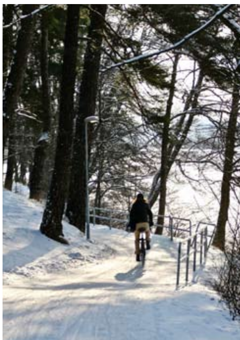
Dubbdäck gör vinterresan lättare.

Börja inifrån och bygg sedan på i takt med att kylan tilltar. Ytterplagget bör alltid vara någon form av vindtätt material som har förmåga att andas. Händer och fötter är alltid utsatta områden. Använd gärna en tunn liner under ytterhandsken om det är kallt. På fötterna rekommenderar vi skoskydd utanpå dina skor som även skyddar vid regn, alternativt vinterskor.