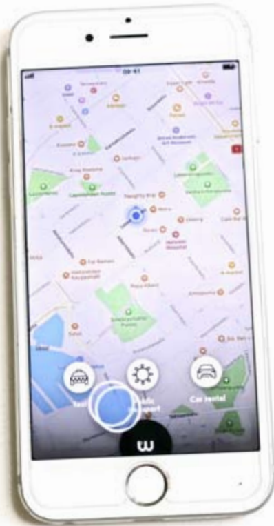
Appar tillgängliga för mobilanvändare.

Hur framtidens resande kommer att se ut kan vi bara sja om. Men med mobilitet som en attraktiv och tillgänglig tjänst för många, finns det helt klart potential för en växande skara framtida mobilister som reser mer resurseffektivt.